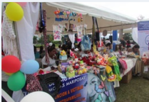
Stands participantes de la Feria del Asocio para el Crecimiento que se llevó a cabo el 6 de diciembre de 2013 en Metrocentro, San Salvador

La embajada de los Estados Unidos de América, con el apoyo de USAID, y la Secretaría Técnica de la Presidencia organizaron La Feria del Asocio para el Crecimiento para celebrar el segundo aniversario de este acuerdo.